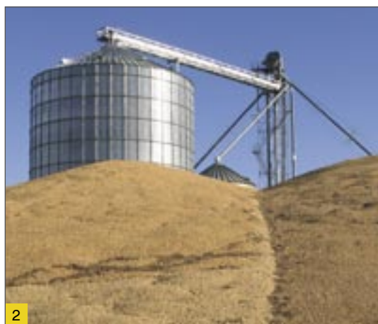
2. sz. ábra: Az alkalmazási terület magába foglalja a gabonasilót is