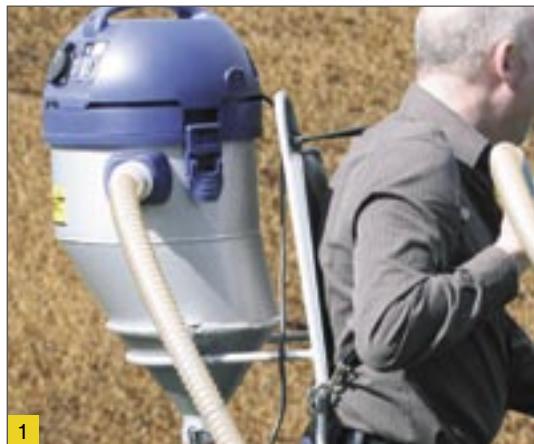
1. sz. ábra: Mintavevő vállhevederrel mint hordozható készülék

(A műszaki továbbfejlesztésből eredő változtatások jogát fenntartjuk.)